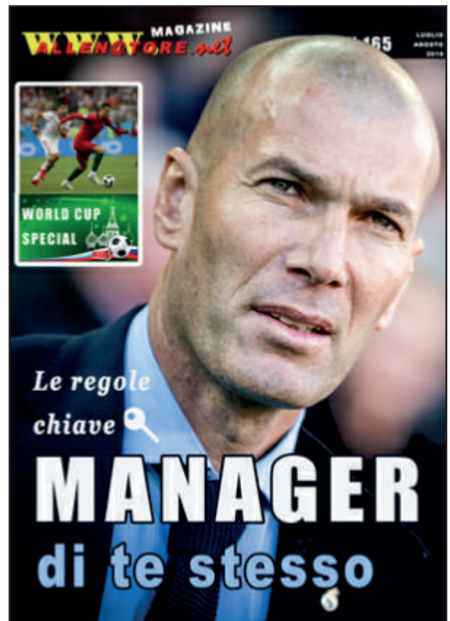
La copertina del mese raffigura Zinedine Zidane, Ecco, a seguire, gli altri contributi.